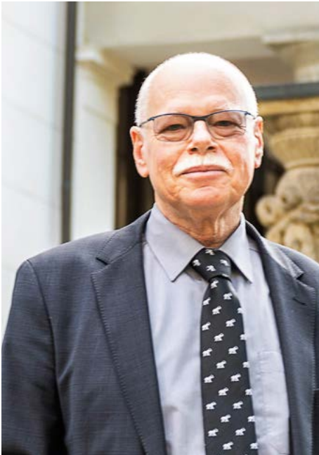
Ulrich Mäurer Senator für Inneres und Sport