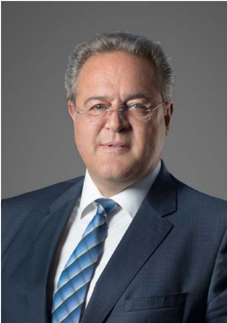
Dr. Dieter Romann Präsident des Bundespolizeipräsidiums

Sehr geehrte Damen und Herren, liebe Kolleginnen und Kollegen, liebe Sportlerinnen und Sportler,